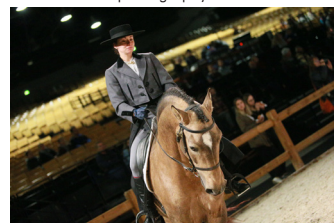
Présentation de race

Cette 5 e édition ne dérogera pas à sa réputation d'être LE salon de la jeunesse et de la proximité . Défileront sur les carrières, démonstrations et spectacles pour le plus grand plaisir des amoureux du cheval. Les passionnés découvriront la grande diversité du monde équestre au travers des présentations de races et des multiples démonstrations de disciplines équestres (dressage, voltige, amazone, polo etc.). Le Salon met un point d'honneur à faire la part belle aux artistes, amateurs ou professionnels, en leur donnant carte blanche pour la présentation de leurs spectacles et numéros équestres, pendant quatre jours.